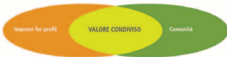
Fig. 2 – La creazione di valore condiviso

Come emerso dalla ricerca "Welfare e Ben-essere: il ruolo delle imprese nella sviluppo della comunità" , le policy e le pratiche operative che migliorano la competitività di un'azienda migliorano, allo stesso tempo, le condizioni economiche e sociali delle comunità in cui opera. L'impresa diventa quindi attore per lo sviluppo attraverso la creazione di valore condiviso (cd. shared value ), ovvero la creazione di valore economico congiuntamente al valore per la società, dando risposta ai bisogni e alle sfide cui questa deve far fronte (Porter e Kramer, 2011) 14 (Figura 2). La ricerca analizza alcuni casi studio di produzione di valore condiviso da parte delle imprese for profit presenti sul territorio regionale. Lo studio dei casi ha rilevato come la generazione di valore condiviso secondo diverse modalità ha ricadute positive sia interne (ad esempio in termini di efficientamento, di cultura d'impresa, di crescita delle competenze del personale dipendente), che esterne all'impresa influenzando sul miglioramento della coesione sociale o sul rapporto con la Pubblica Amministrazione.